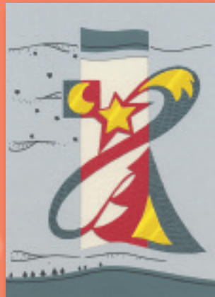
„Baum Rot/Gold“ Bestellnummer o8W207 €1,95