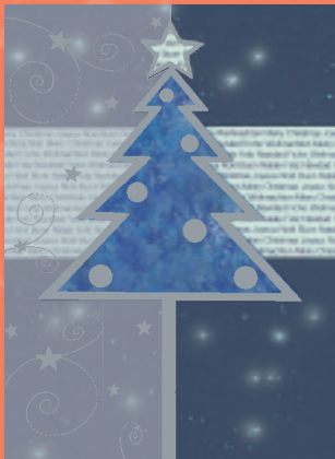
„Weihnachtsbaum international“ Bestellnummer o8W209 €1,95

Jetzt neu: Weihnachts- karten-Edition 2008