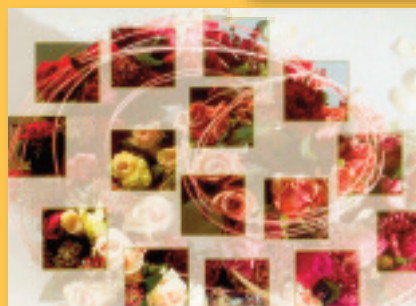
„Rosige Einblicke“ Bestellnummer 06G198 €1,45

Clappkarten im Format 15,5 x 11 cm geschlossen