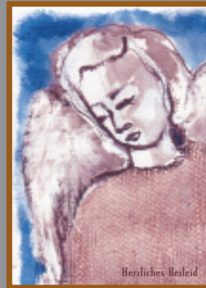
„Engel“ Bestellnummer 06T147 € 1,45

Wenn Sie Unternehmens-Schutzengel werden möchten, tragen Sie bitte bei der Überweisung das Stichwort „Unternehmens-Schutzengel 2009“ ein.