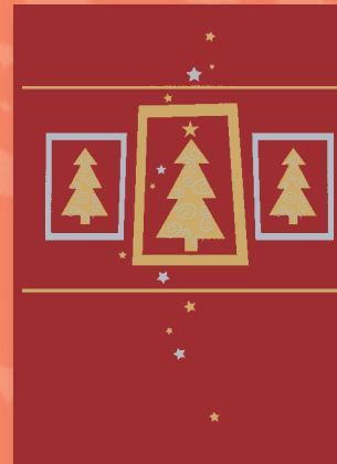
„Goldene Tannenbäume“ Bestellnummer o8W210 €1,95

„Christbaumkugeln“ Bestellnummer o8W208 €1,95 Einleger in rot, blau und gold erhältlich