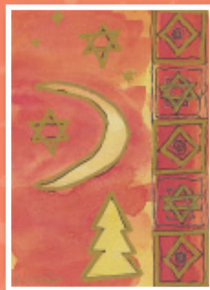
„Goldsterne“ Marie-Luise Kohlhöfer Bestellnummer o8W215 €1,45