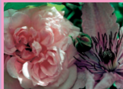
„Rose“ Barbara Haberland Bestellnummer 08G203 €1,45