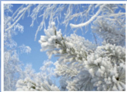
„Blick in den Winterhimmel“ Bestellnummer 08W213 €1,45