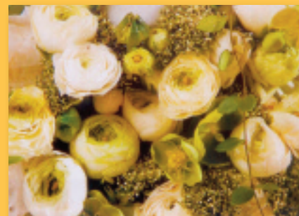
„Anemonen“ Bestellnummer 06G197 €1,45