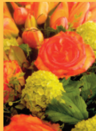
„Frühlingsstrauß“ Bestellnummer 06G196 €1,45