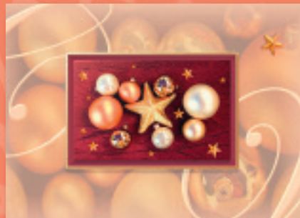
„Weihnachtliche Impression“ Bestellnummer o8W211 €1,75