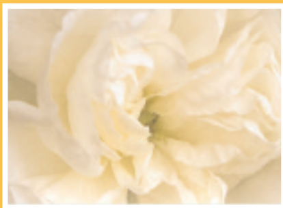
„Rose“ Bestellnummer 06G195 €1,45