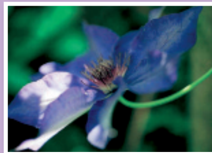
„Clematis“ Barbara Haberland Bestellnummer 08G202 €1,45