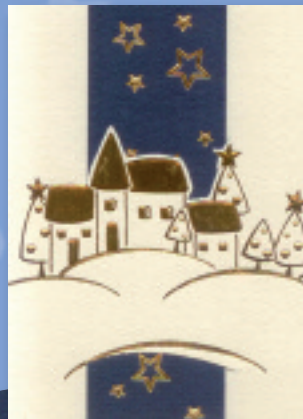
„Festliches Dorf“ Bestellnummer 07W201 €1,95