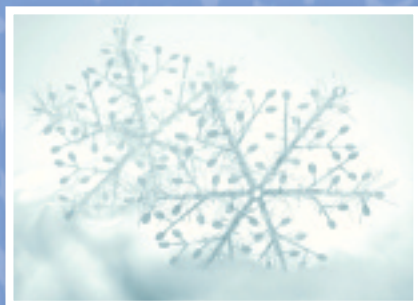
„Eiskristalle“ Bestellnummer 08W212 €1,45