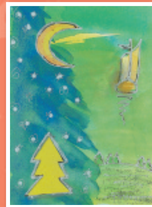
„Himmelsbarke“ Marie-Luise Kohlhöfer Bestellnummer o8W214 €1,45

Alle Karten können Sie im Internet vergrößert betrachten: