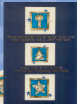
„Weihnachten international“ Bestellnummer 07W203 €1,95