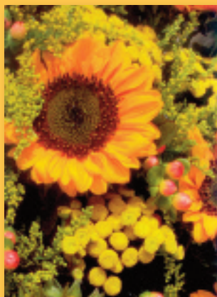
„Sonnenblume“ Bestellnummer 05G193 €1,45

Clappkarten im Format 15,5 x 11 cm geschlossen