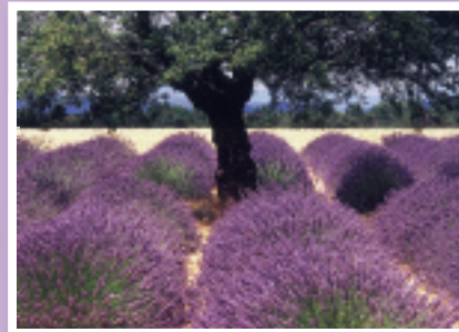
„Lavendel“ Peter Baus Bestellnummer 08G201 €1,45