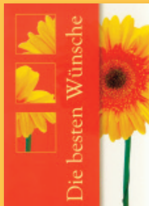
„Die besten Wünsche“ Bestellnummer 06G199 €1,45