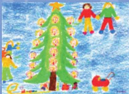
„Weihnachtliche Kinderfreuden“ Lenka, 8 Jahre Bestellnummer 07W202 €1,45